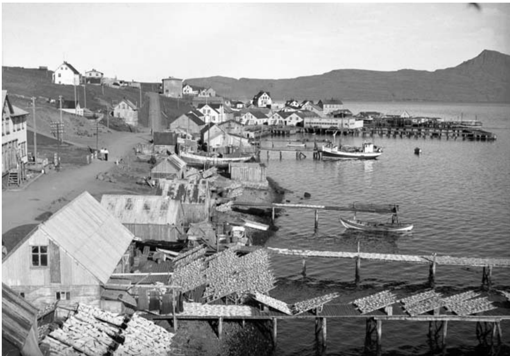
Norðfjörður 1919.