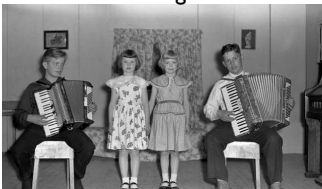
Leikrit í Nesskóla 1955