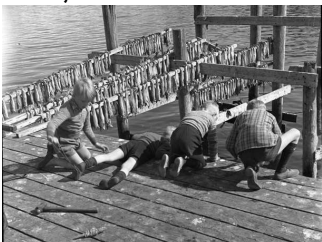
Hvað er norðfirskara en börn á bryggju að veiða