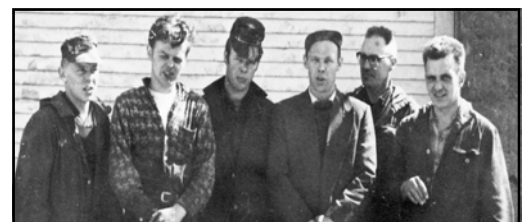
Starfsmenn bílaverkstæðis Dráttarbrautarinnar árið 1963