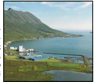
Norðfjörður um 2006