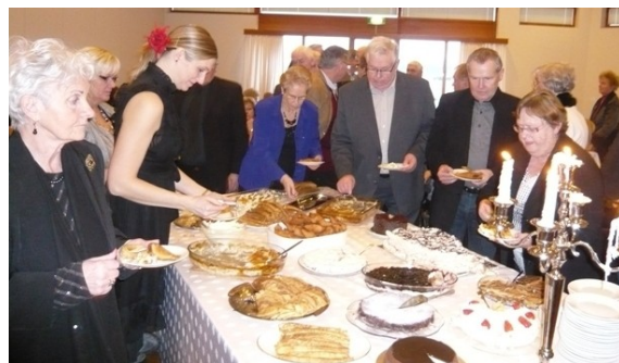
Við hlaðborðið á Sólarkaffi Norðfirðingafélagsins 2010